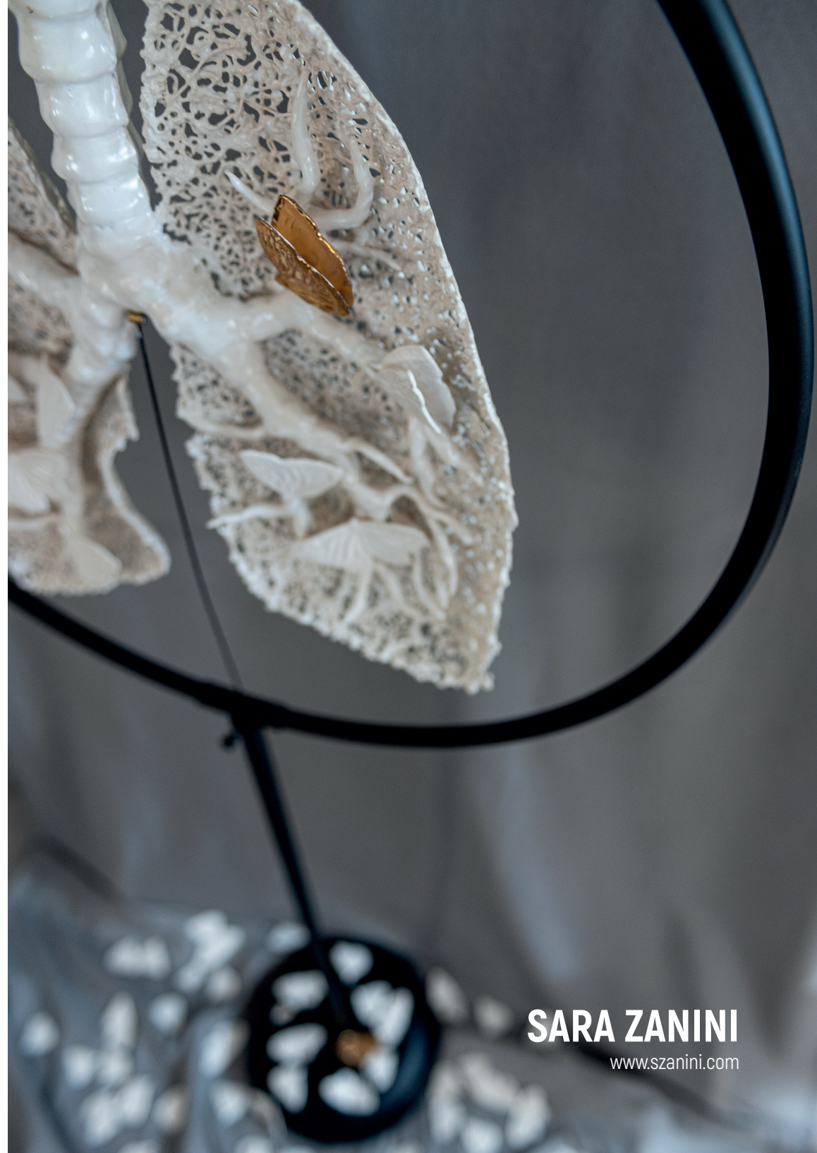
Anatomía de lo efímero (detalle) Cerámica, metal y madera / 59 x 158 x 59 cms.