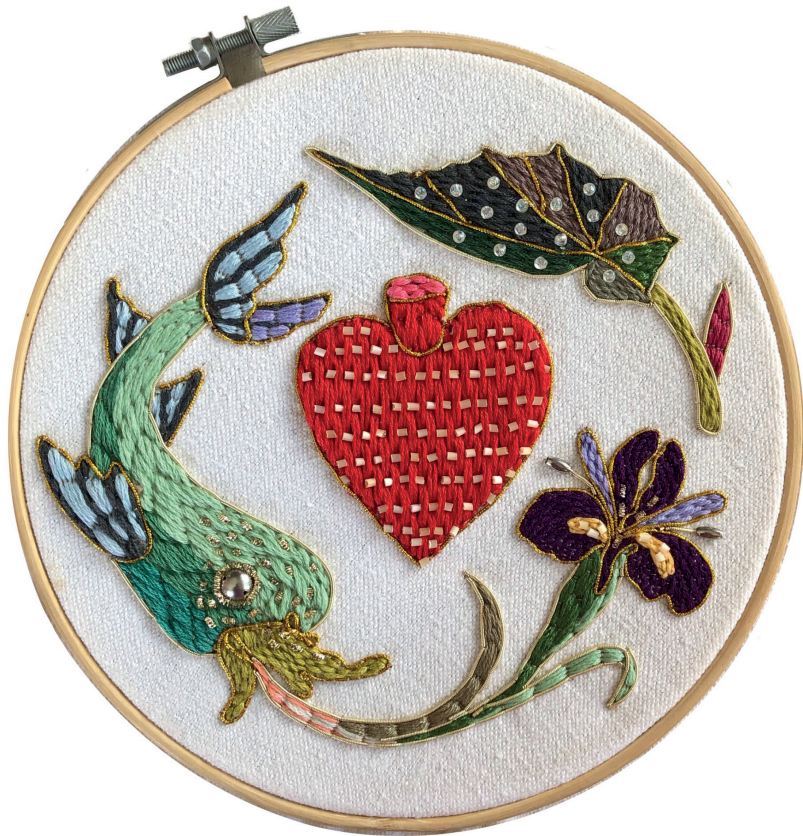
Corazón rampante Bordado sobre tela / 18 cms. diámetro

Alejandro Grande Terracota dorada y policromía / 40 x 45 x 12 cms.