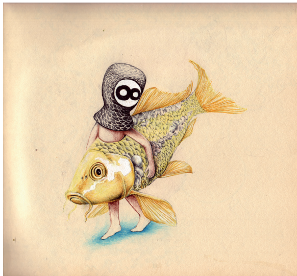
Ego 7 y Ego 9 Bolígrafo sobre papel / 21 x 21 cms. c.u.