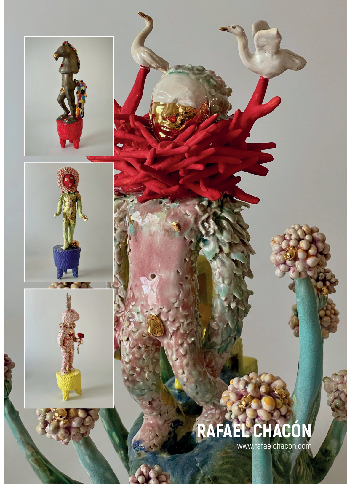
Jardinero de octubre (detalle) Gres, esmalte de alta y oro en 3er. fuego / 37 x 30 x 28 cms.